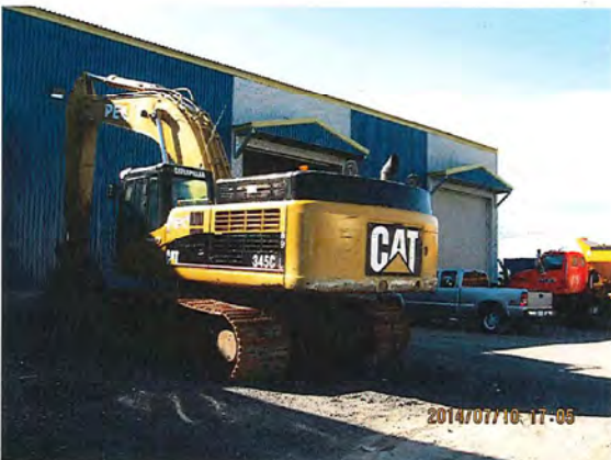
IMG_0074.jpg Photo 5. Entrée du garage