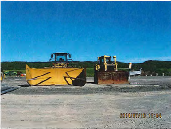
IMG_0072.jpg Photo 3. Machinerie sur le site