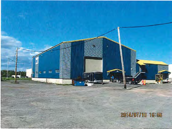
IMG_0070.jpg Photo 1. Le bâtiment de l'usine