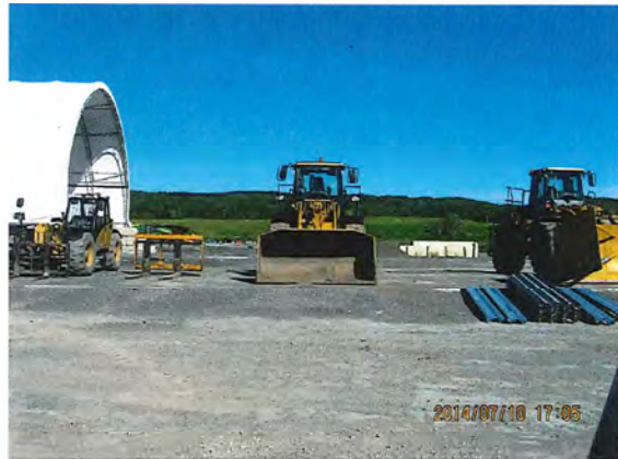
IMG_0073.jpg Photo 4. Idem