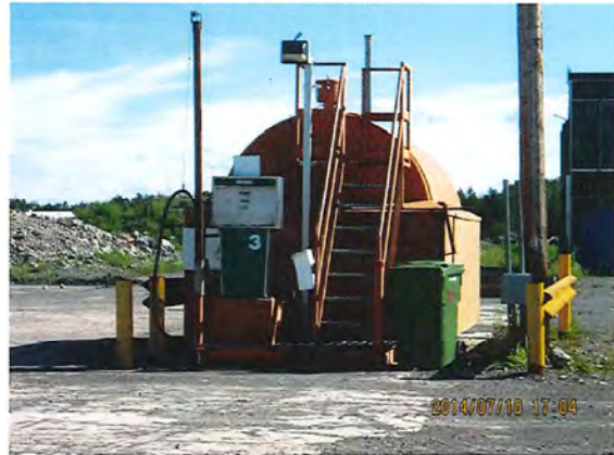
IMG_0071.jpg Photo 2. Réservoir de diesel pour l'approvisionnement de la machinerie